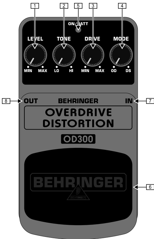
Обзор верхней части