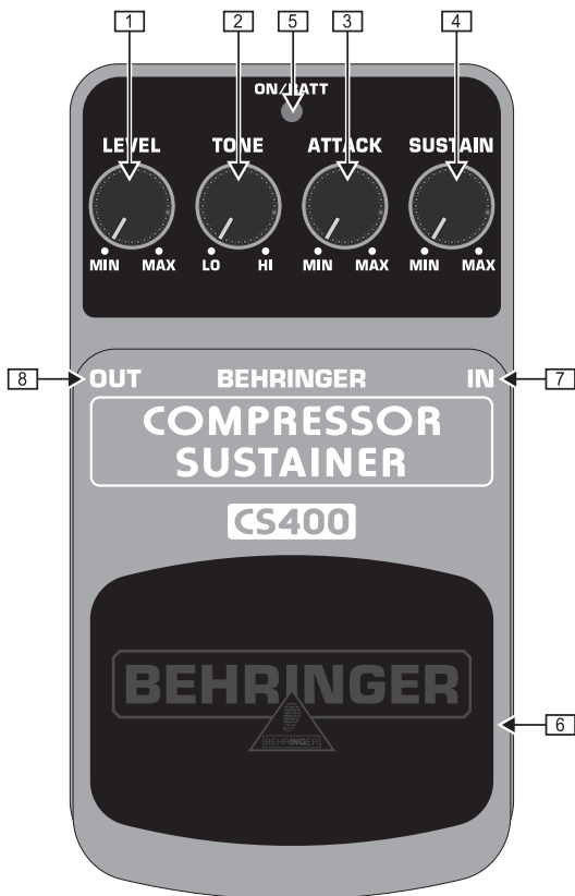
Обзор верхней части