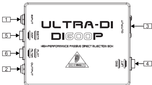
Рис. 1: Вид сверху