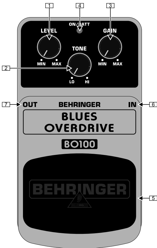
Обзор верхней части