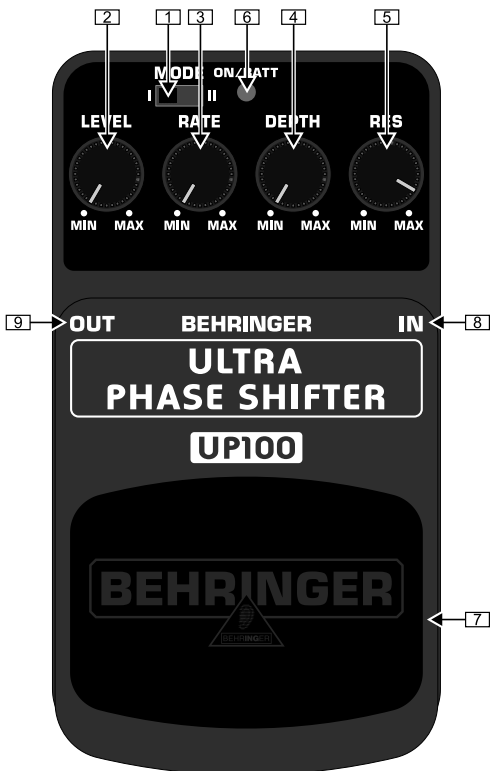
Обзор верхней части