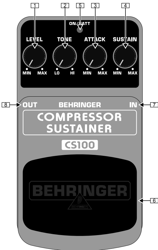
Обзор верхней части